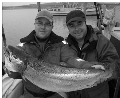
2009 suurin taimen ja Kaartoahot.

Kilpailun voittaja julistetaan ja palkitaan vuosikokouksessa. Voittajalle ilmoitetaan postitse.